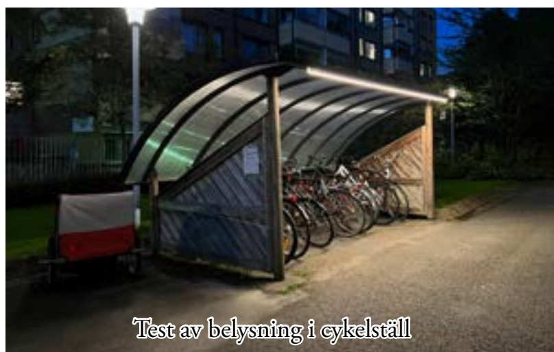
Test av belysning i cykelställ